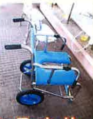
シャワーキャリー